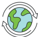
Bod ar flaen y gad yn y byd modern